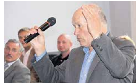
Triukšmo problemos auditorijos nepaliko abejingos

Triukšmą kenčiame ne tik dėl nekultūringų kaimynų, bet ir dėl kiaurų namų sienų, intensyvaus eismo, buvo konstatuota Sūduvos forumo diskusijoje apie triukšmą.